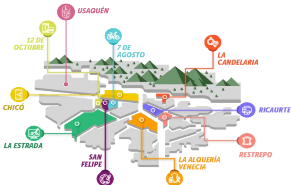
Mapa del Programa Bogotá Corazón Productivo 2024.